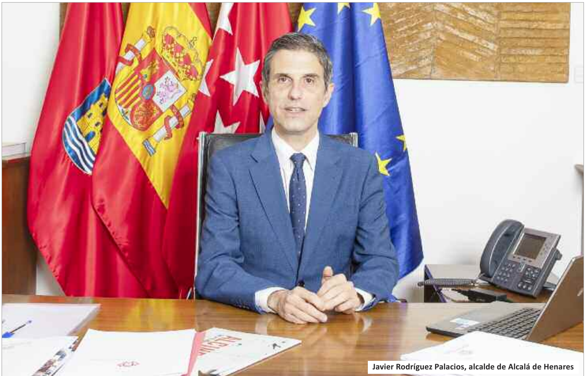
Javier Rodríguez Palacios, alcalde de Alcalá de Henares

“Gracias a la buena gestión y al trabajo del equipo de Gobierno hemos saneado las cuentas públicas, saldremos del Plan de Ajuste y seguiremos realizando inversiones para mejorar los barrios y seguir con el plan de peatonalización del casco histórico”