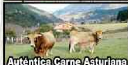
Auténtica Carne Asturiana